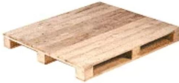
Four Way Entry Close Boarded, 3 Base